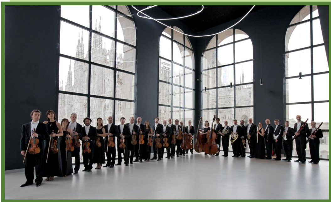
Orchestra I Pomeriggi Musicali