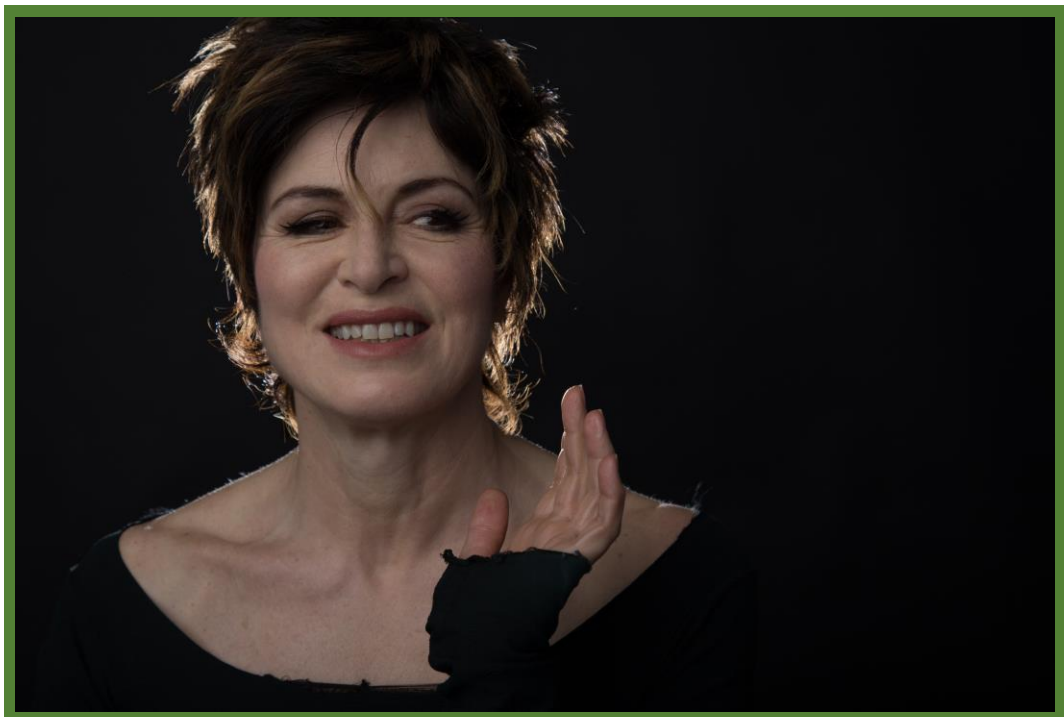
Anna Caterina Antonacci